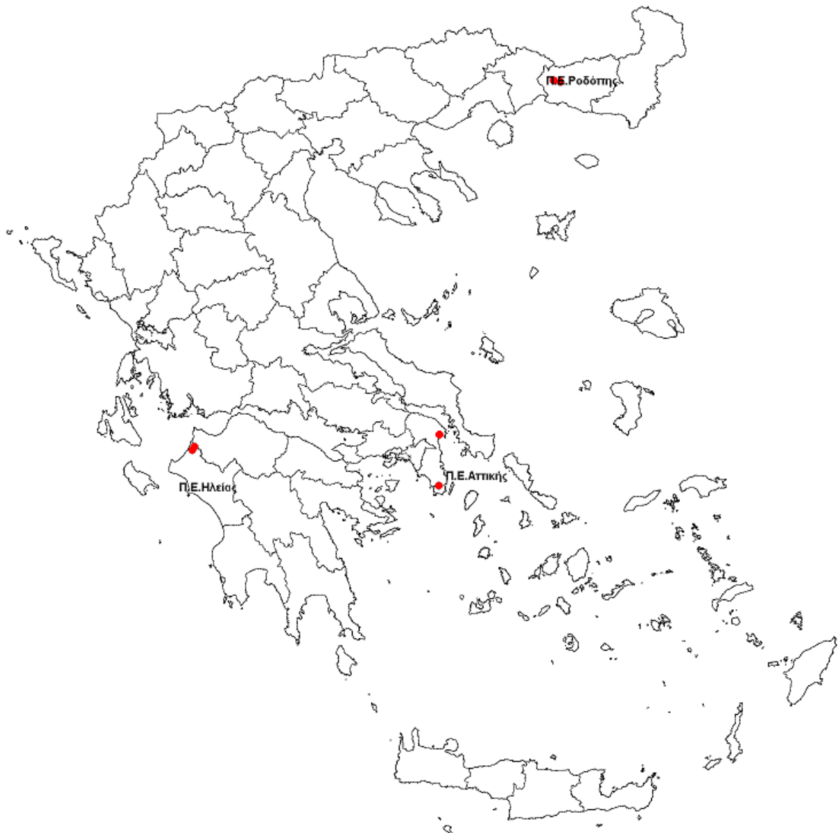
Εικόνα 2: Χάρτης με αποτύπωση του εκτιμώμενου τόπου έκθεσης των δηλωθέντων κρουσμάτων λοίμωξης από τον ιό του Δυτικού Νείλου, Ελλάδα, 2014, έως 28.08.2014, ώρα 11.00 π.μ. (n=6).*