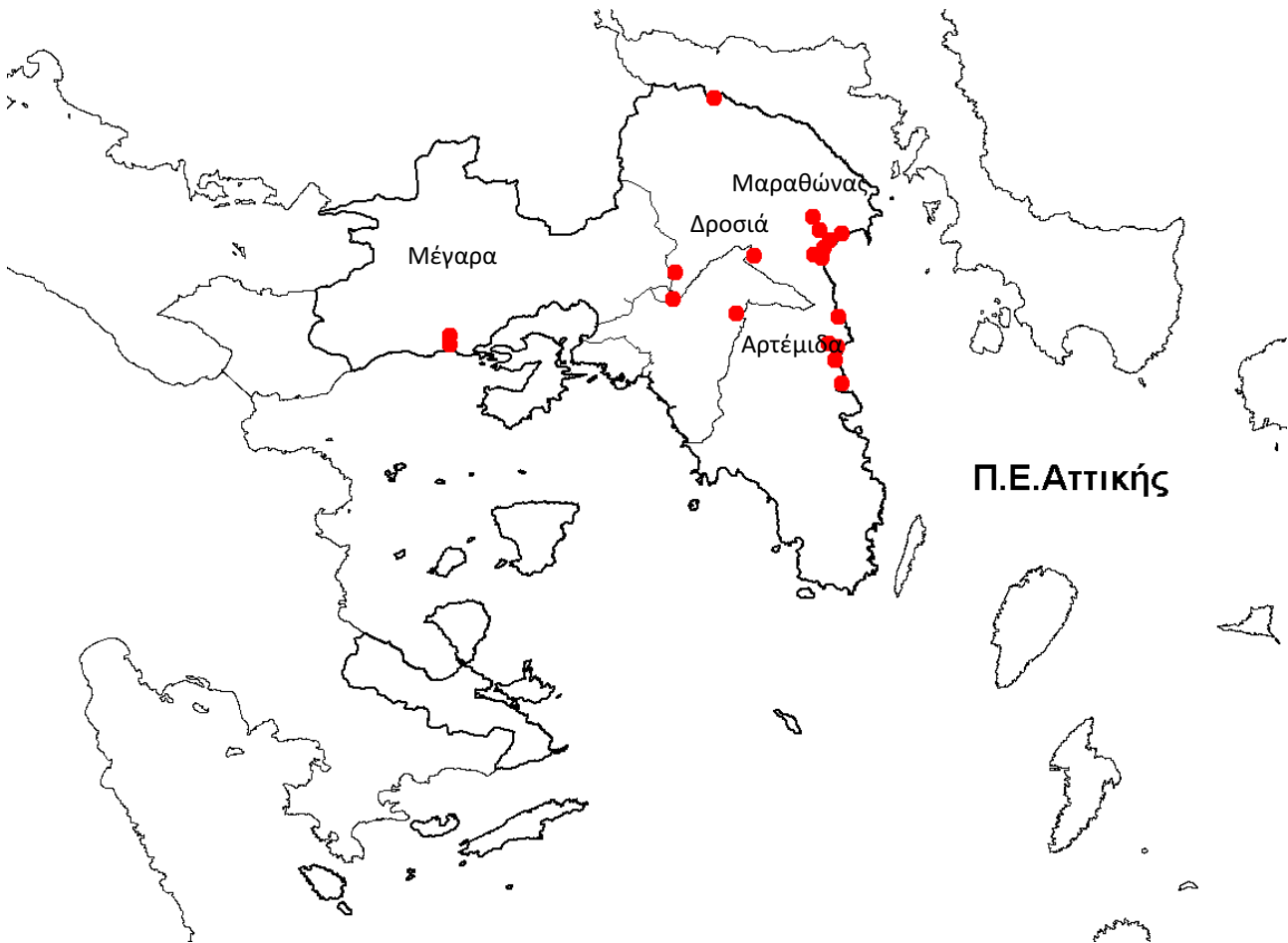
Εικόνα 3: Χάρτης με αποτύπωση του τόπου κατοικίας των ασθενών με εργαστηριακή διάγνωση λοίμωξης από τον ιό του Δυτικού Νείλου με εκδηλώσεις από το κεντρικό νευρικό σύστημα στην περιοχή της Αττικής. Περίοδος 2011 έως 12.10.2011 (ώρα 16.00)