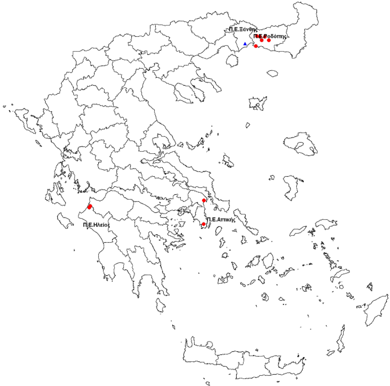
Εικόνα 2: Χάρτης με αποτύπωση του εκτιμώμενου τόπου έκθεσης των δηλωθέντων κρουσμάτων λοίμωξης από τον ιό του Δυτικού Νείλου, Ελλάδα, 2014, έως 04/09/2014, ώρα 11.00 π.μ. (n=11).*