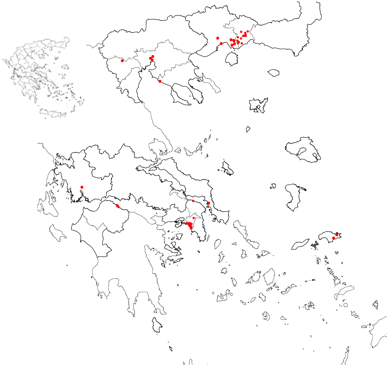
Εικόνα 2: Χάρτης με αποτύπωση του πιθανού τόπου έκθεσης των ασθενών με εργαστηριακή διάγνωση λοίμωξης από ιό του Δυτικού Νείλου με εκδηλώσεις από το κεντρικό νευρικό σύστημα (n=64). Περίοδος 2012, έως 23.08.2012 (ώρα 16.00).